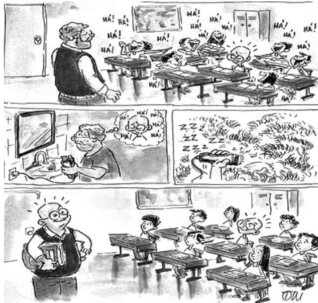
( https://www.reddit.com .)

Sabendo que as tirinhas são utilizadas para fazer humor, criticar ou ironizar, a qual propósito se presta a tirinha acima? Utilize de 5 a 8 linhas para redigir o seu texto.