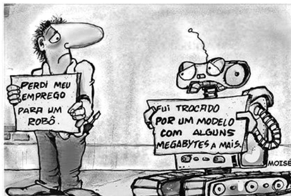
( https://br.pinterest.com )

(Adaptado de: https://sejarelevante.fdc.org.br )